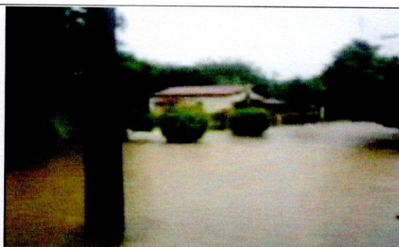
Enchente em Almirante Tamandaré - 30 de Janeiro de 2010 - Bairro Bonfim - imagens pela manhã - 08:00